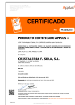
EN 12150-2:2004 Vidrio para la edificación