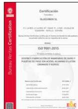
ISO 9001:2015 Sistema de gestión de la calidad