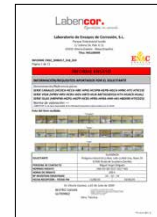
ENSAYOS DE CORROSIÓN Piezas metálicas