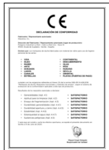
UNE-EN 14428:2016 Mamparas de baño