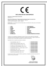
UNE-EN 14428:2016 Mamparas de baño