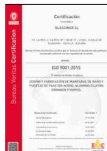
ISO 9001:2015 Sistema de gestión de la calidad