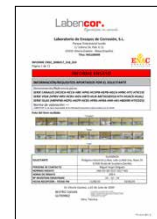
ENSAYOS DE CORROSIÓN Piezas metálicas