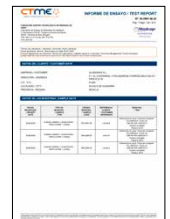
ENSAYOS DE ADHERENCIA Recubrimiento de lacado