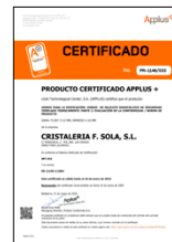
EN 12150-2:2004 Vidrio para la edificación