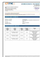
ENSAYOS DE ADHERENCIA Recubrimiento de lacado