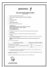
UNE-EN 14428:2016 Mamparas de baño