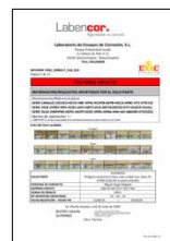
ENSAYOS DE CORROSIÓN Piezas metálicas