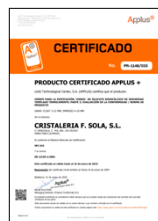
EN 12150-2:2004 Vidrio para la edificación