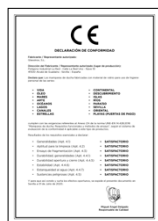
UNE-EN 14428:2016 Mamparas de baño